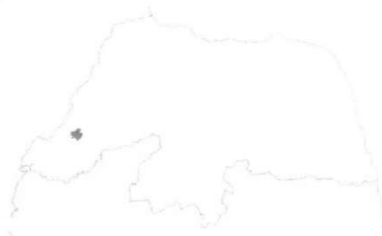
Figura 1: Localização de Portalegre no Mapa do RN.